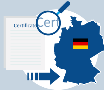
Einschätzung der Anerkennungsfähigkeit des Berufsabschlusses