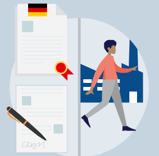
Nur bei Teilanerkennung: Anpassungsqualifizierung und Folgeantrag