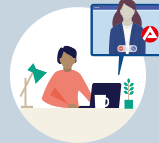
Gespräch mit der Bundesagentur für Arbeit