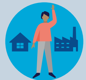
Leben und Arbeiten in Deutschland