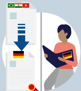
Beginn des Deutschkurses (A1 bis B1) und Antrag auf Anerkennung des Abschlusses