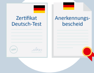
Sprachprüfung und Anerkennungsbescheid