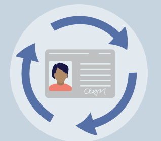
Nur bei Teilanerkennung: Umwandlung des Aufenthaltstitels