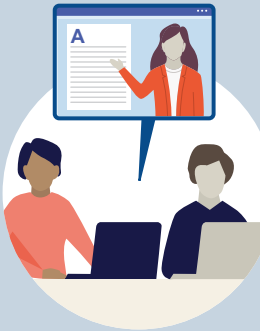
Teilnahme an diversen Workshops zur Ausreisepreparierung