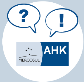
Erstgespräch mit der AHK