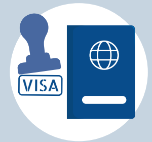
Beantragung des Visums