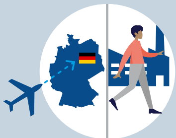
Ankunft in Deutschland und Arbeitsaufnahme