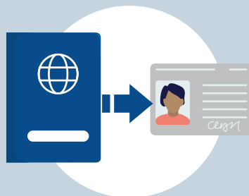
Beantragung des Aufenthaltstitels