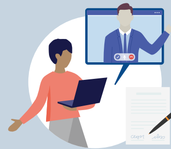
Vorstellungsgespräch mit Unternehmen und Unterzeichnung des Arbeitsvertrags